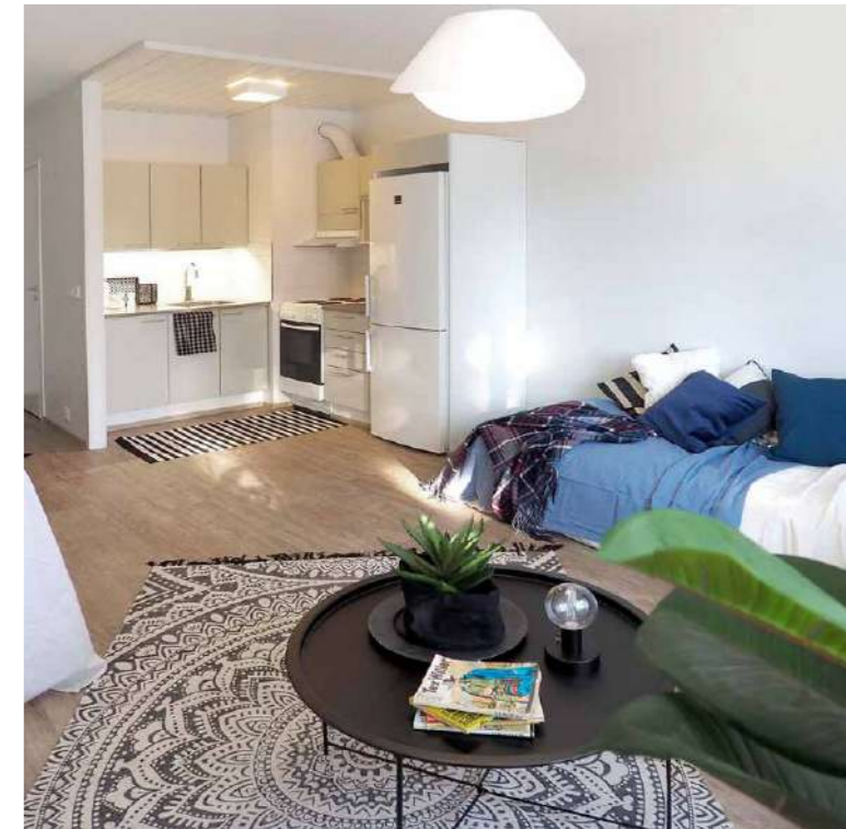
Piennarkadun asuntokuvista saa ideoita pienen yksión sisustamiseen.

” Kattoon heijastuva epäsuora valo on paljon miellyttävämpi kuin koko huoneen valaiseva, jatkuva yleisvalo. ”